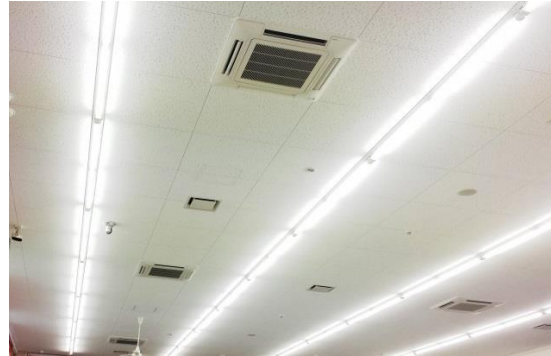
設備はそのまま、照明のみ LED に交換して節電